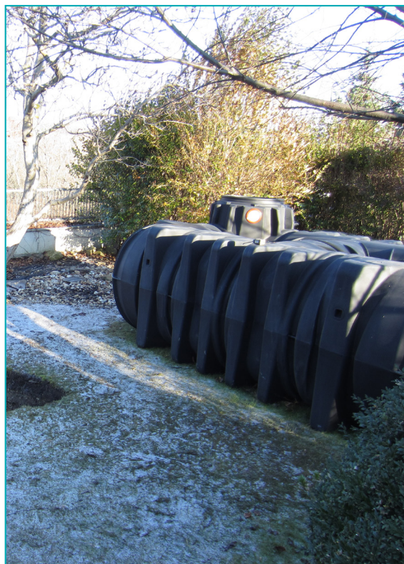
Nádrž na zachyt dažďovej vody pred umiestnením do zeme

Dotácie sú financované z rozpočtu mesta Bratislava. Výška celkových pridelených prostriedkov bola 50.000 EUR v roku 2016 a 40.000 EUR v roku 2017. Táto suma sa rozdelí medzi približne 40 až 50 žiadateľov. Dotácia vždy pokrýva 50 % celkových nákladov zariadenia, až do maximálnej výšky 1 000 EUR na jednu žiadosť. Žiadateľom je poskytnuté mestom Bratislava okrem dotácie aj poradenstvo pri implementácii a propagácii projektu.